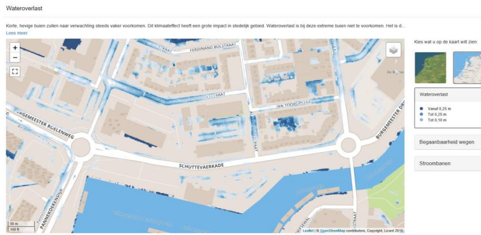
Figuur 2. Kaartbeeld wateroverlast door neerslag.

Bij extreme neerslag is er wateroverlast in de nabijgelegen openbare ruimte (figuur 2). Zie ook: https://wdodelta.klimaatatlas.net/